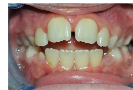
8 ans - référence